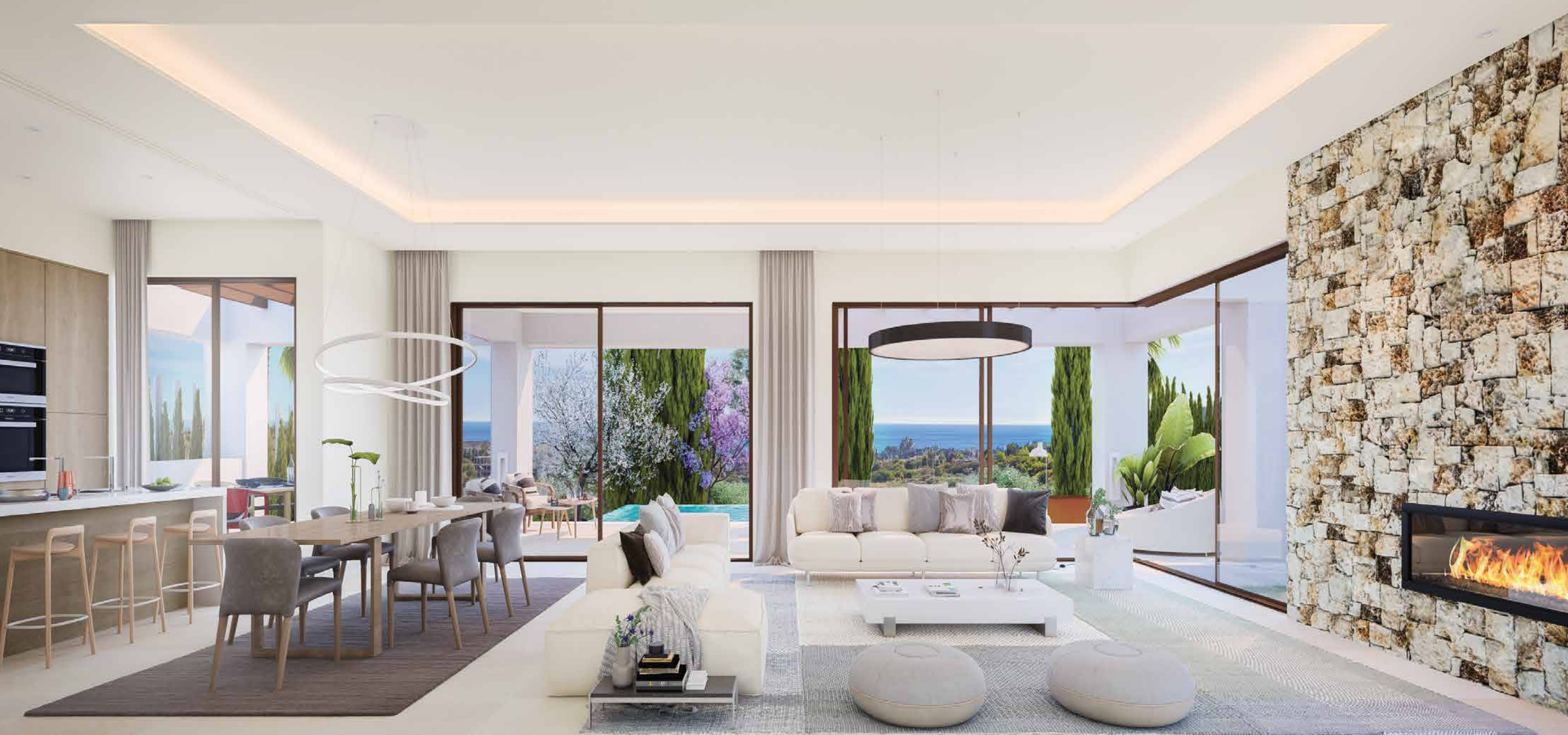
Villas Tomillo living room | Villas Tomillo salón