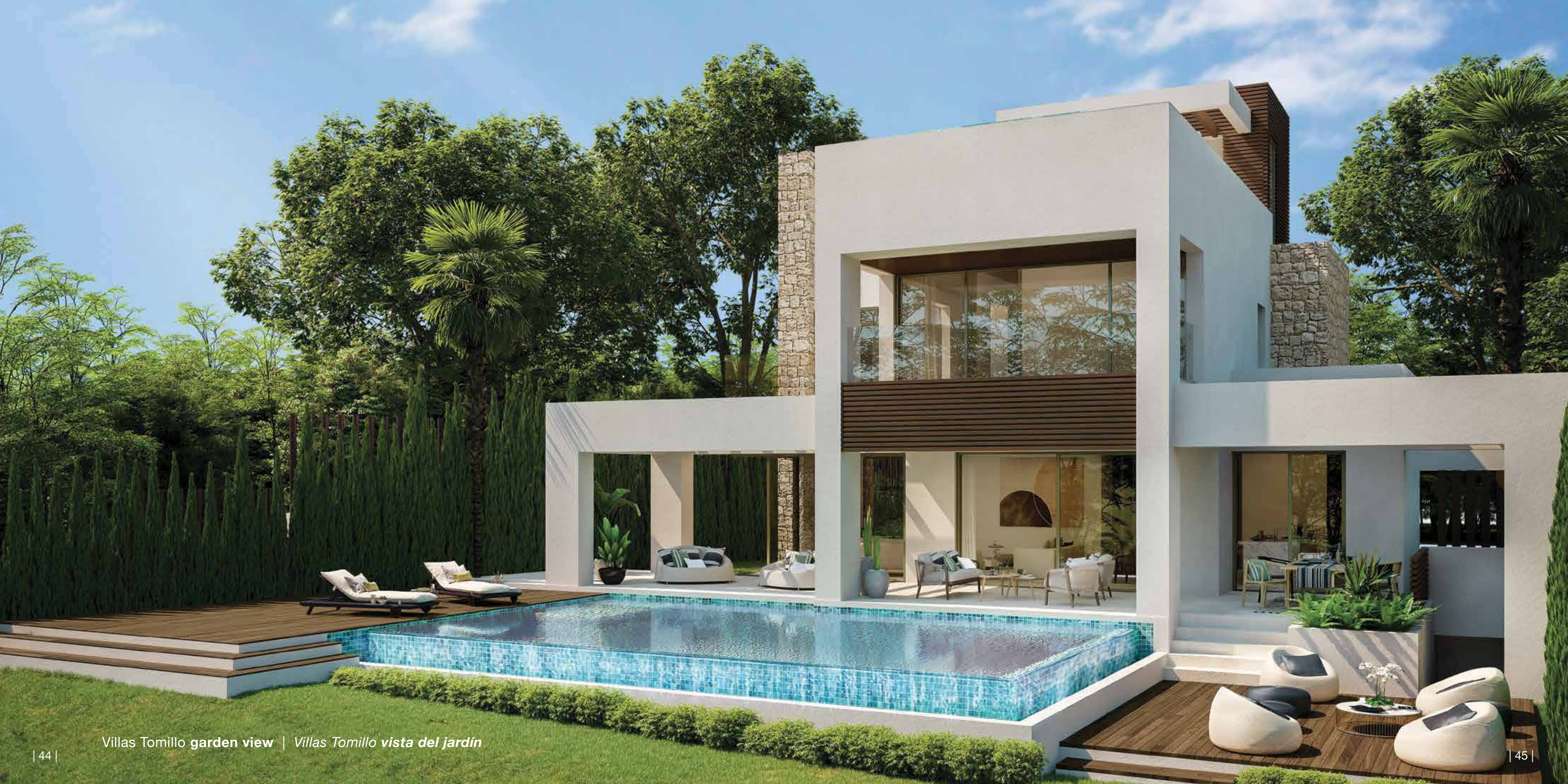
Villas Tomillo garden view | Villas Tomillo vista del jardín