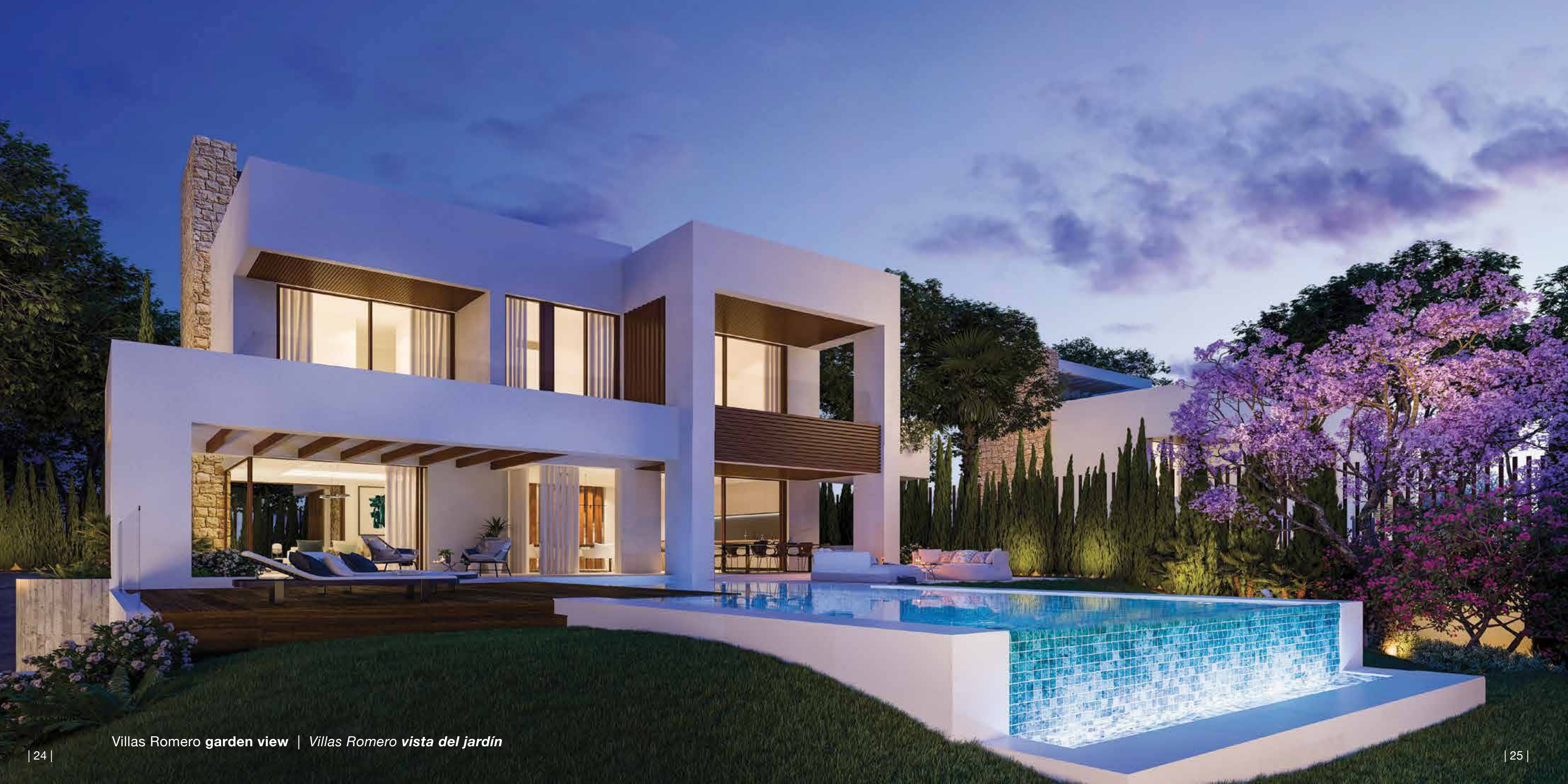
Villas Romero garden view | Villas Romero vista del jardín