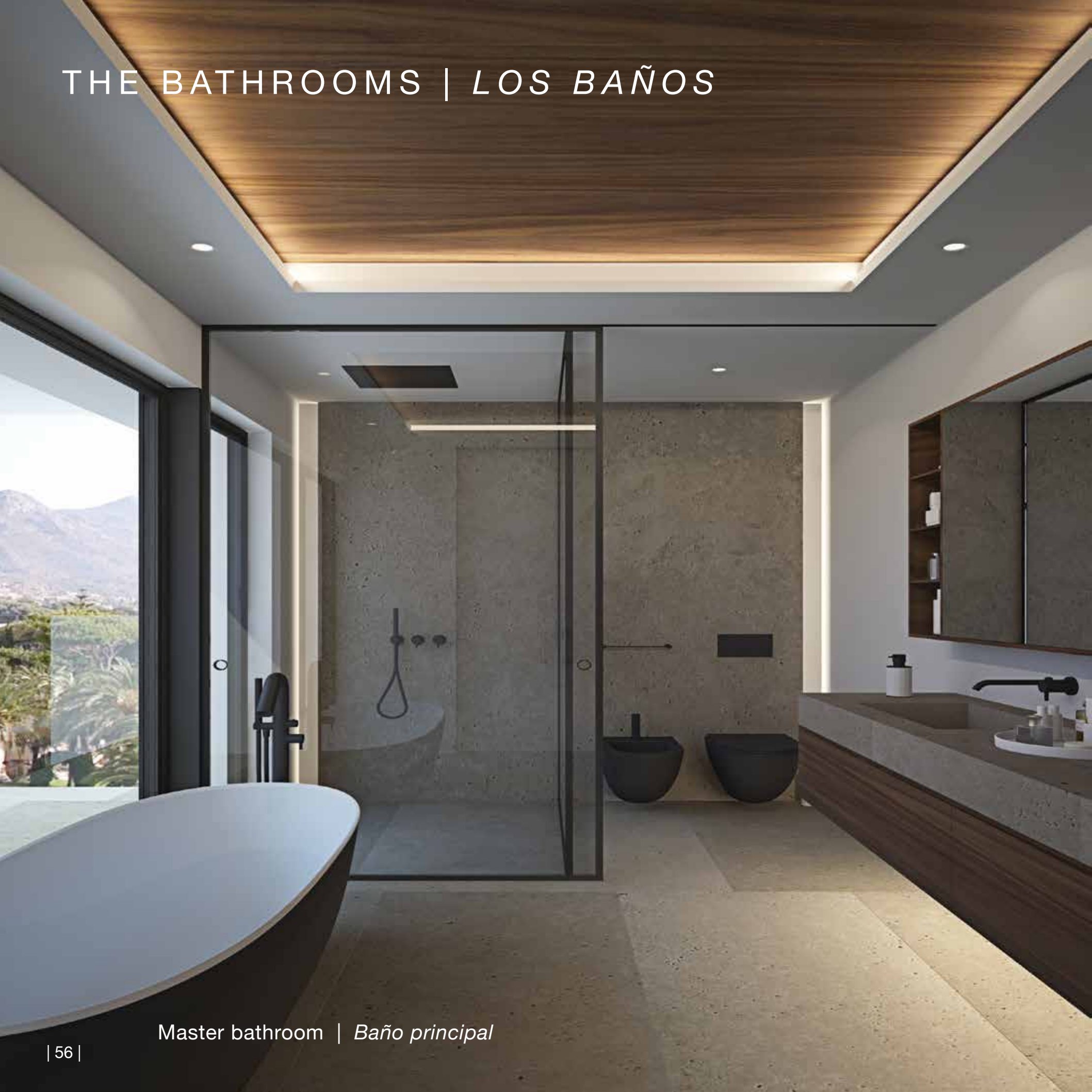
Master bathroom | Baño principal