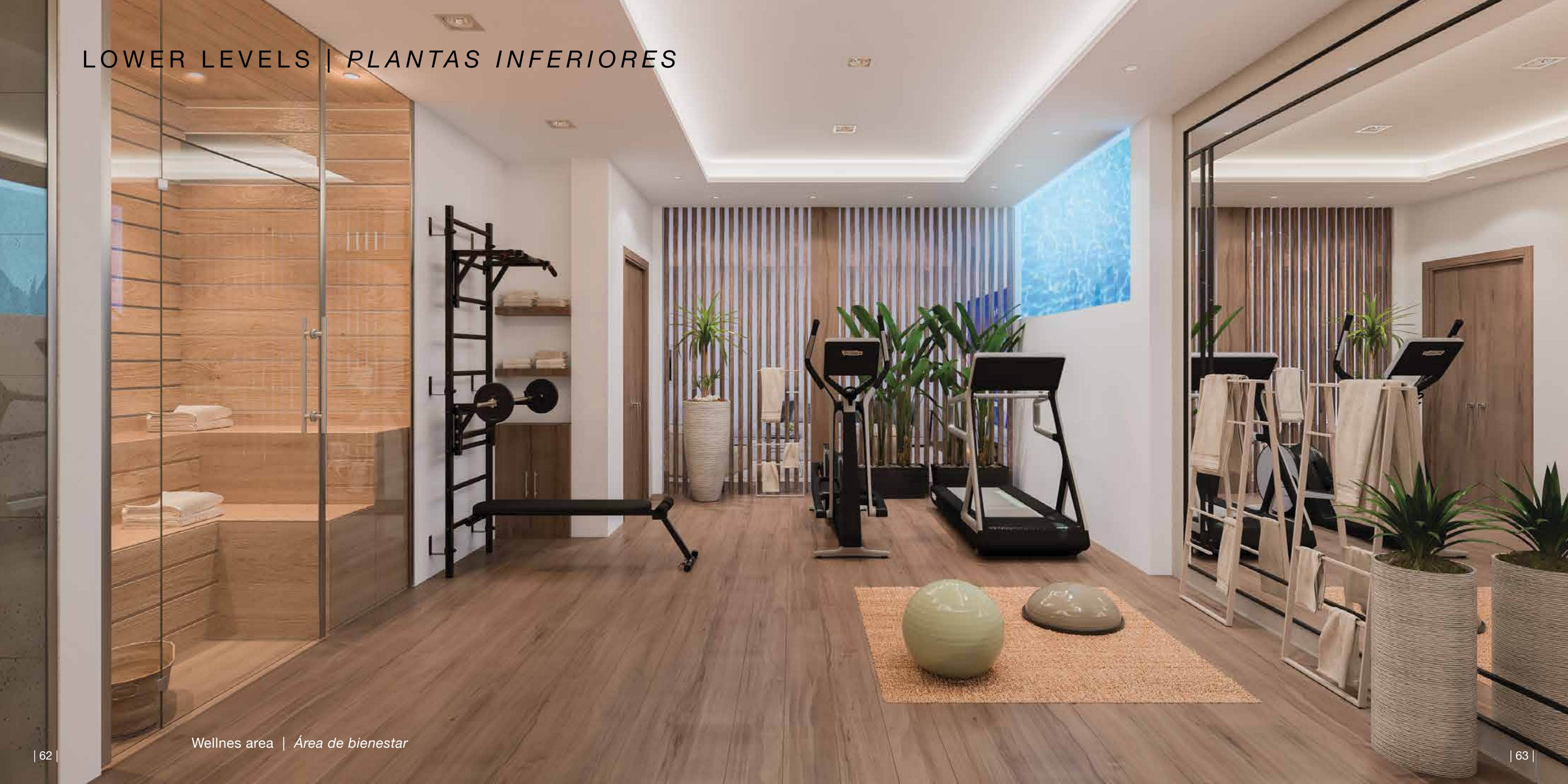
Wellnes area | Área de bienestar