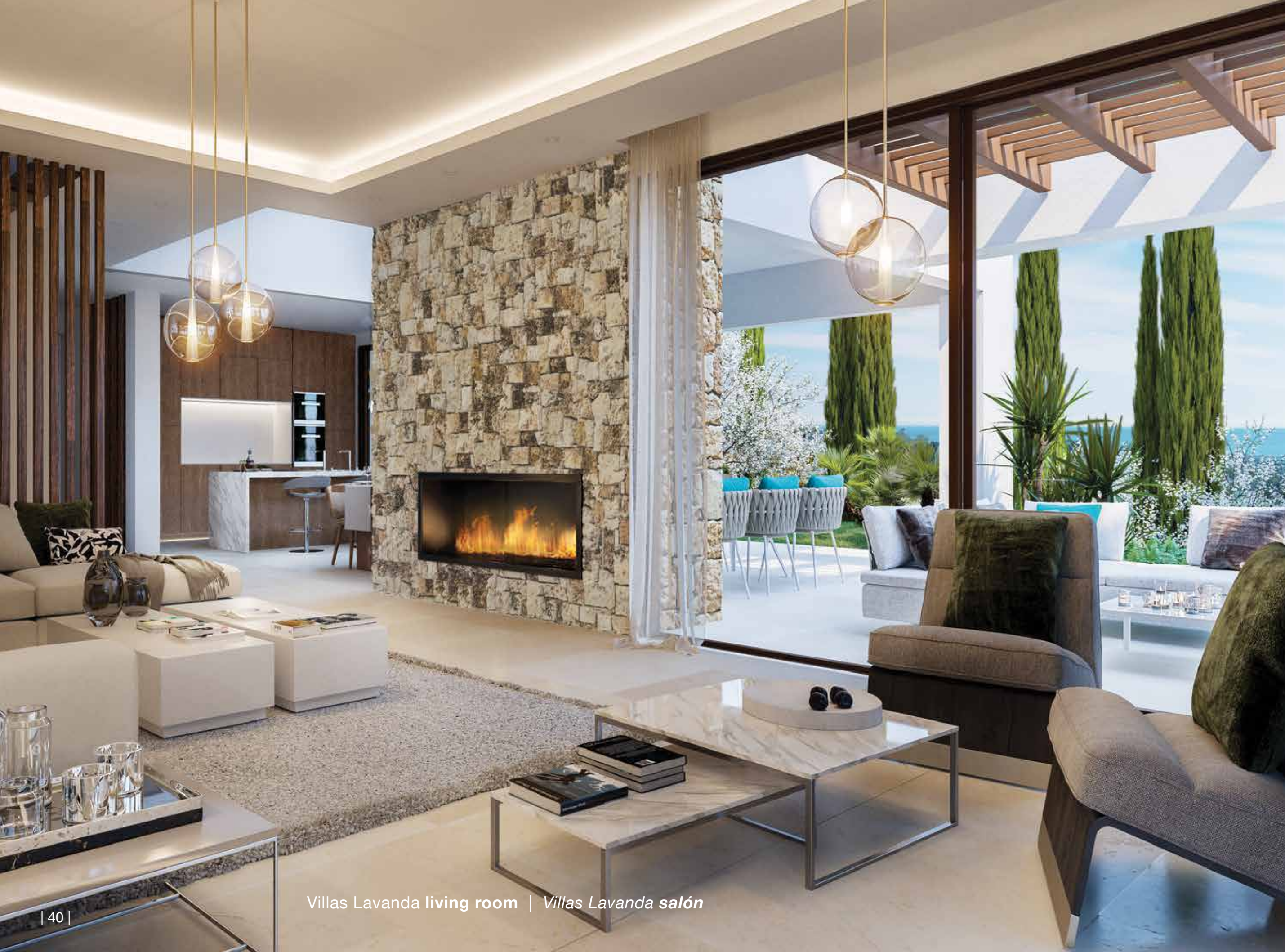
Villas Lavanda living room | Villas Lavanda salón