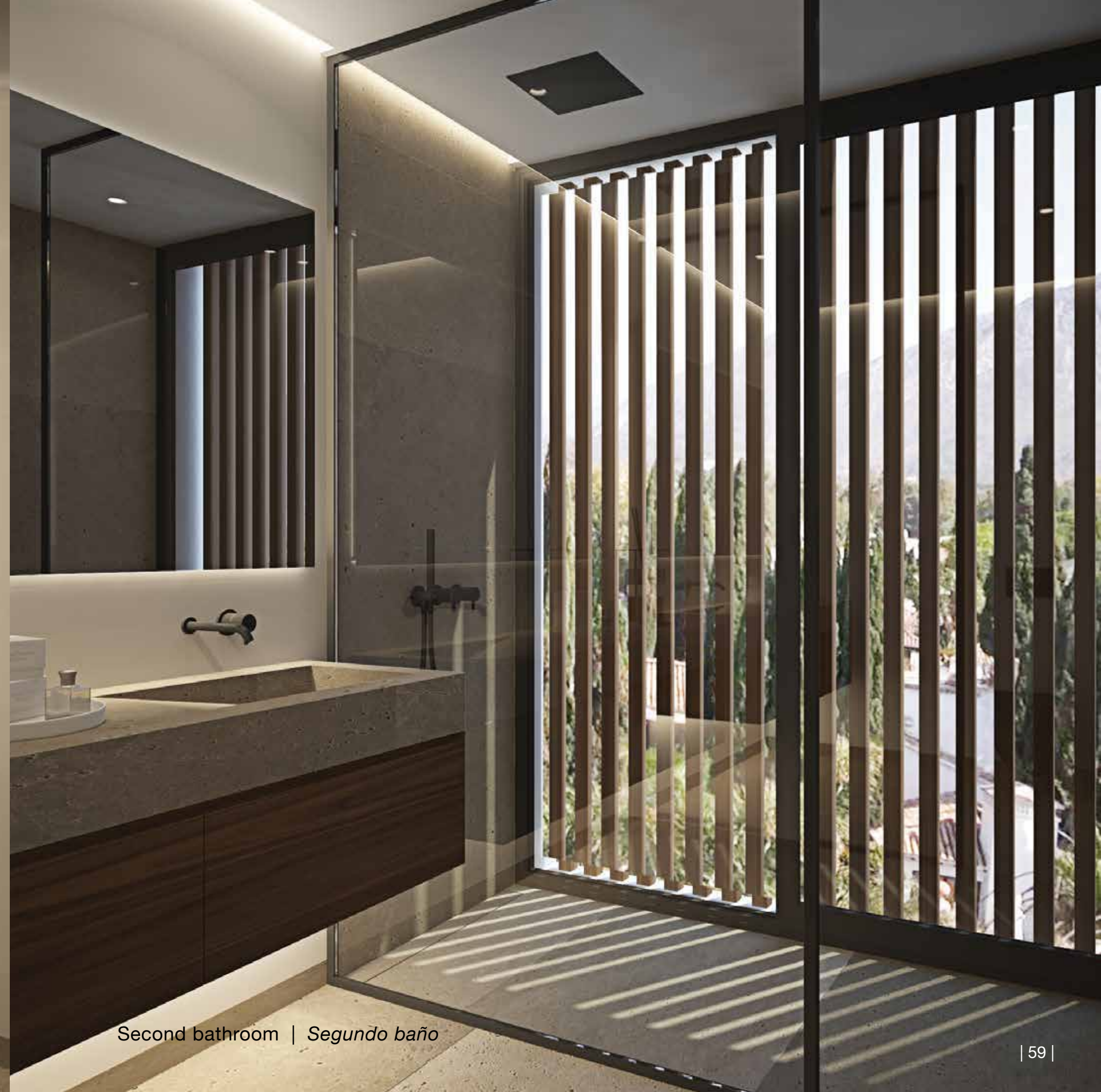
Second bathroom | Segundo baño