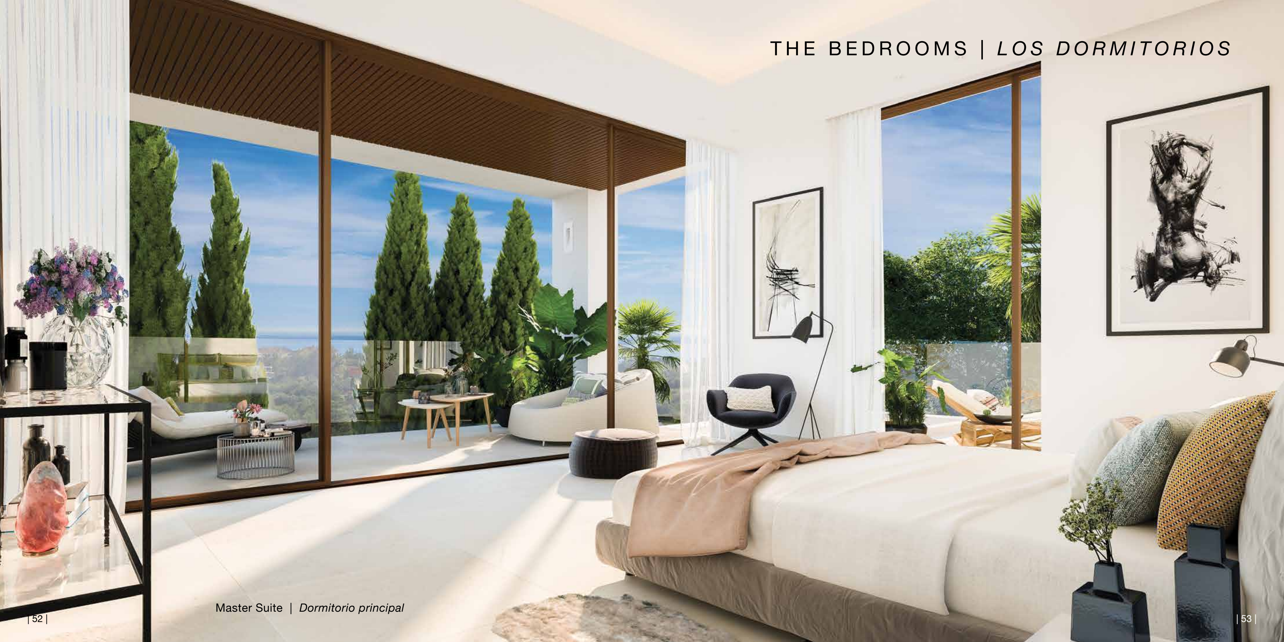
Master Suite | Dormitorio principal