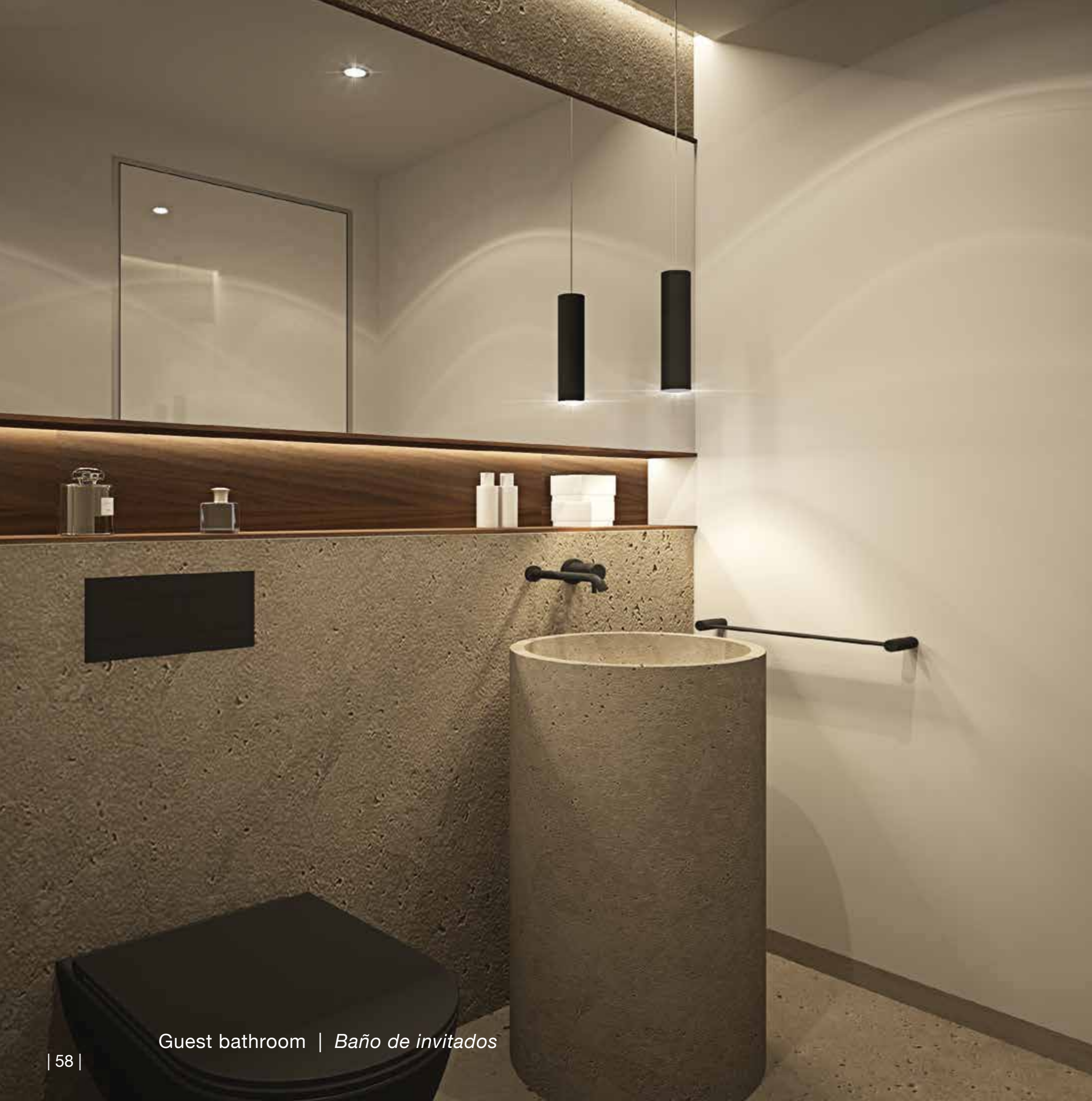
Guest bathroom | Baño de invitados