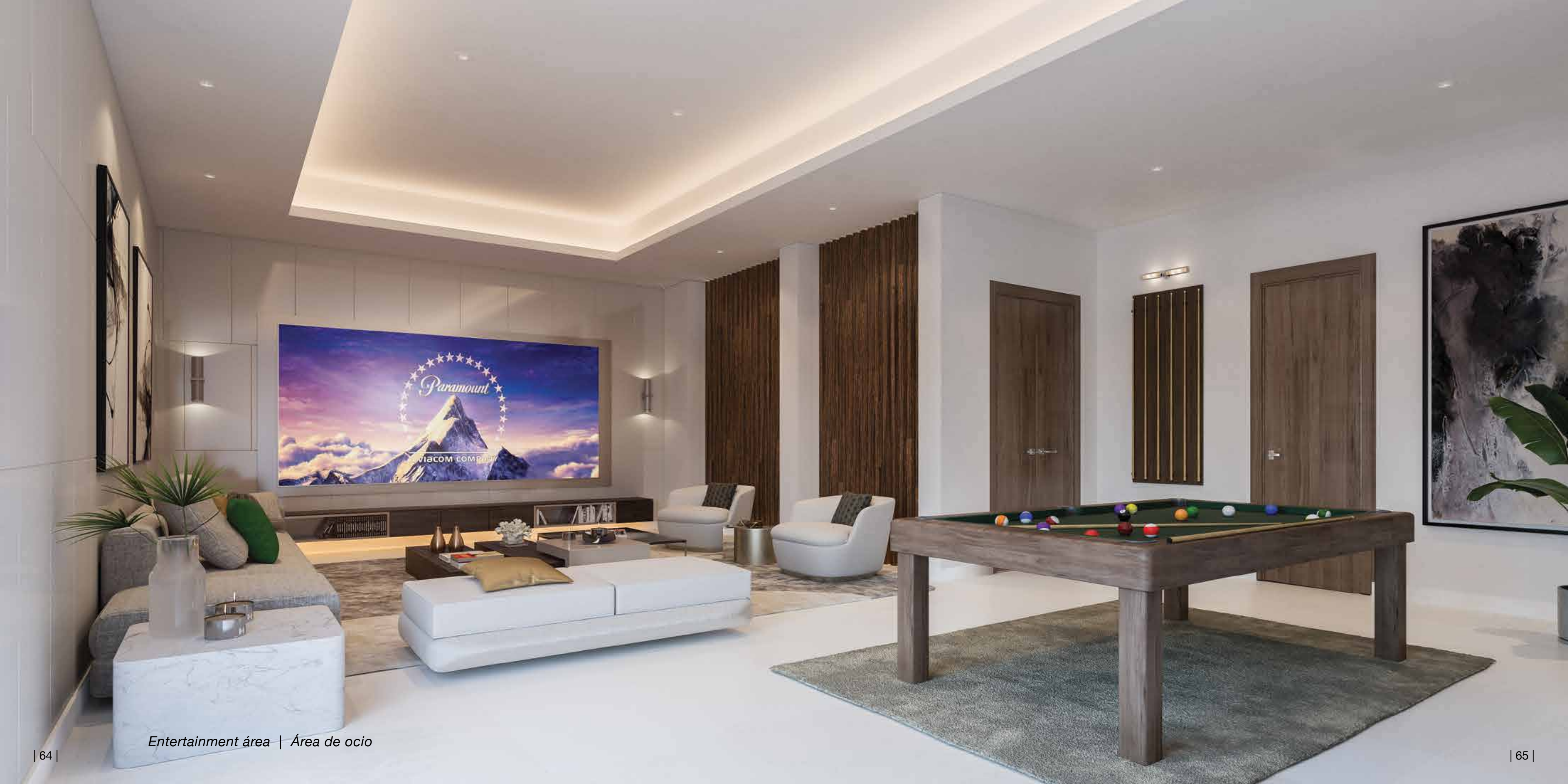
Entertainment área | Área de ocio