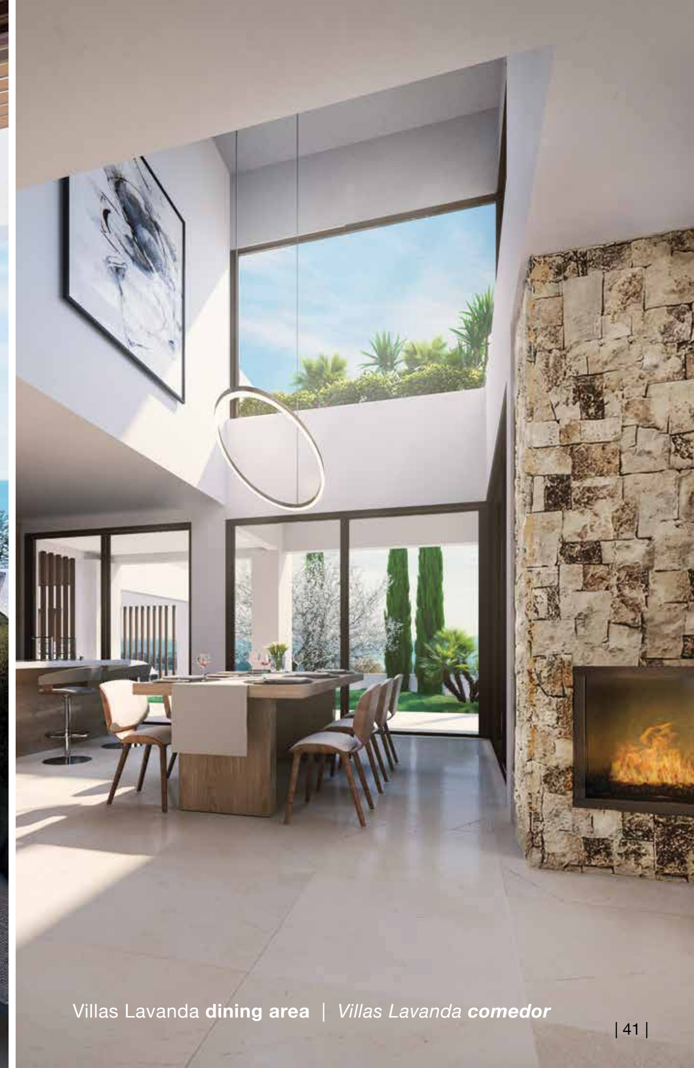
Villas Lavanda dining area | Villas Lavanda comedor