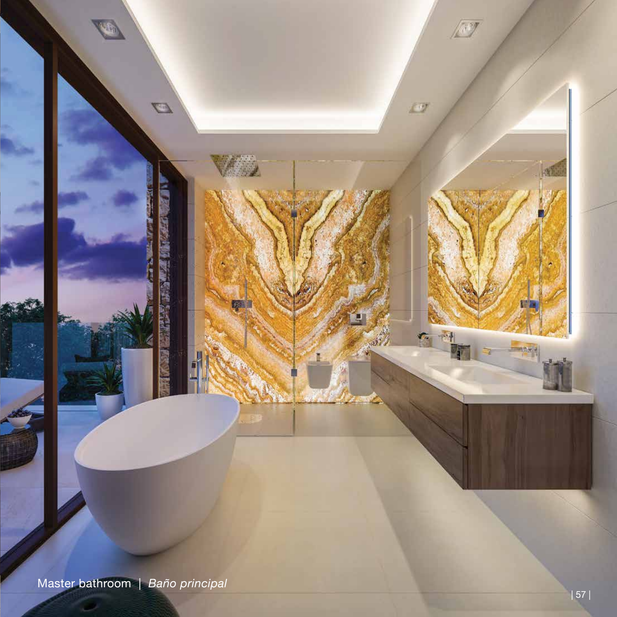
Master bathroom | Baño principal