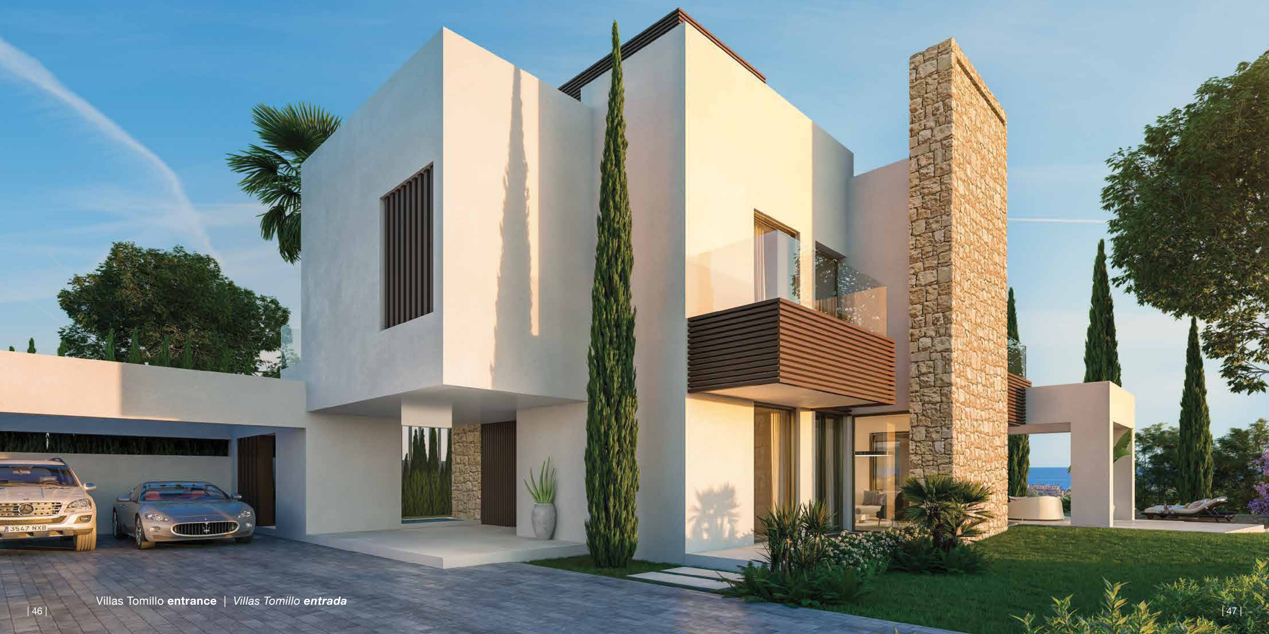
Villas Tomillo entrance | Villas Tomillo entrada